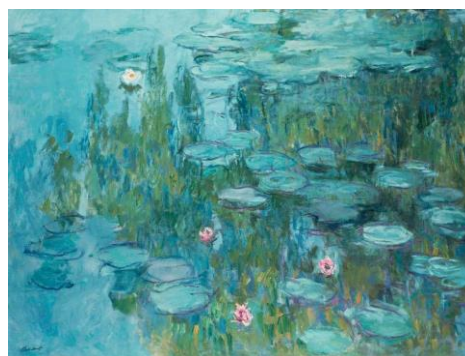
Claude Monet (1840-1926)