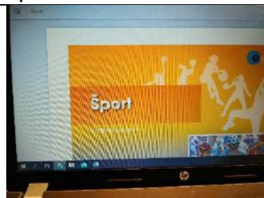
E-učbenik (meni je levo zgoraj)